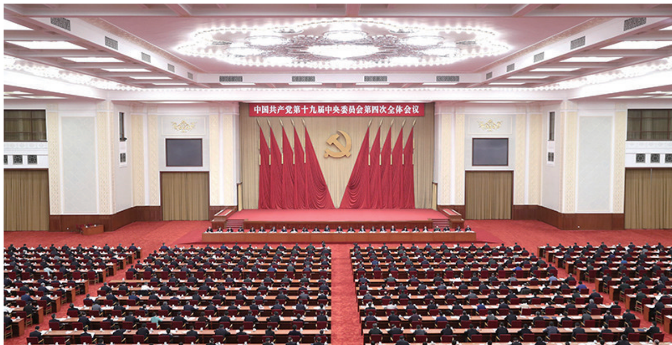
中国共产党第十九届中央委员会第四次全体会议,于2019年10月28日至31日在北京举行。